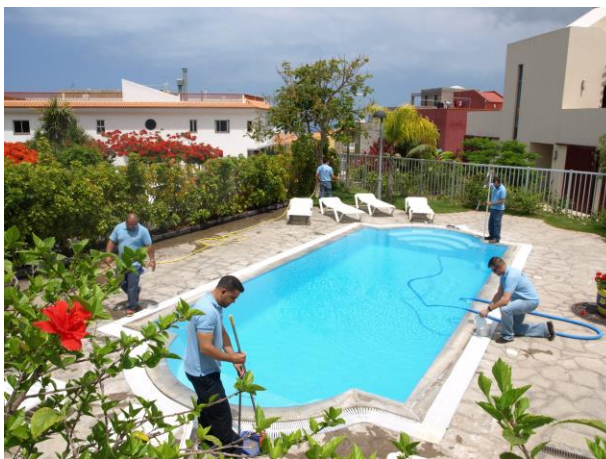
Instalación y Mantenimiento de Piscinas en Hoteles y Comunidades y Residencias.