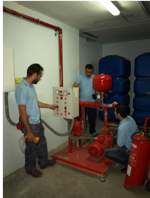
Mantenimiento e instalaciones de Contra incendios en Edificios Públicos, empresas y Comunidades de vecinos en Canarias