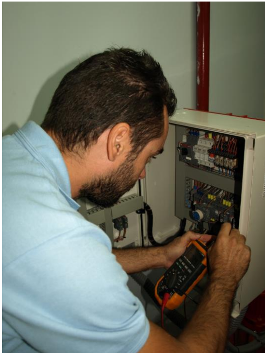
Instalaciones de Baja Tensión en Hoteles, Clínicas, Comunidades y Edificios Públicos y Privados.