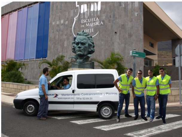
Instalaciones y Mantenimientos en Edificios Públicos y Hoteles