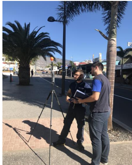
Realización de medidas RMS y EMR en Canarias. Desarrollo de Planes Especiales de Ordenación de las Telecomunicaciones