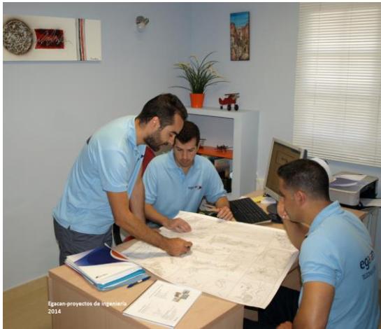
Realización de Proyectos de Ingeniería. Planos. As Built.. DFO. DFI, Prevención de Riesgos Laborales, Replanteos, etc