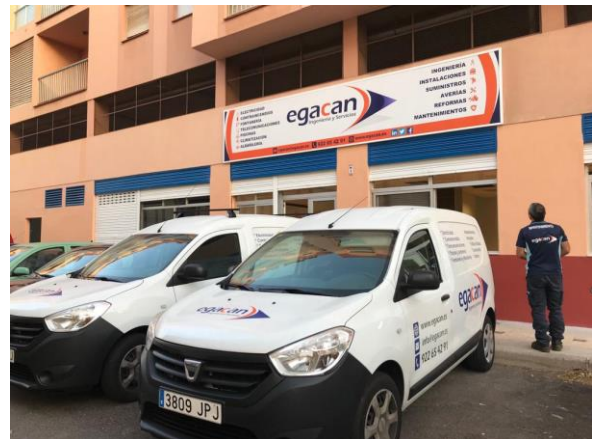
Oficinas Centrales de Egacan Ingeniería y Servicios

Egacan ofrece y realiza todos los servicios que requieren las fases de trabajo de cualquier inversión Industrial, desde los estudios previos del proyecto, pasando por el PROYECTO en sí, hasta la consultoría, dirección de obra, asistencia técnica, puesta en explotación y mantenimiento de las instalaciones. Ofrecemos soluciones específicas y personalizadas, garantizando el cumplimiento de la normativa y la calidad del servicio.